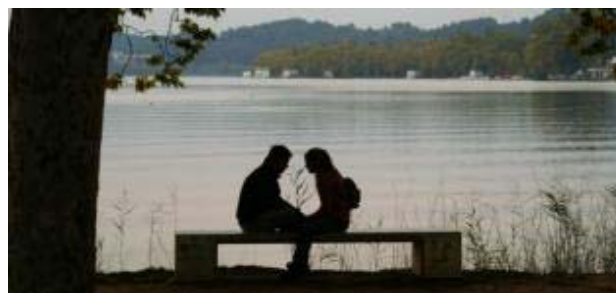
La primavera la sangre altera

EP Un 40% de los españoles considera la primavera como la estación "perfecta" para iniciar un romance pues la llegada del buen tiempo tiene "especial influjo" en la conducta amorosa, según un estudio de Harris Interactive recogido por mobifriends.com.